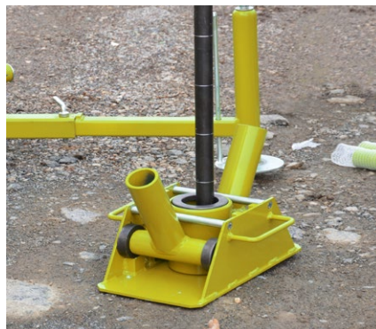
Estrattore manuale per aste Manual rod puller Extracteur de tige manuel Manuelles Ziehgerät Extractor manual de barras