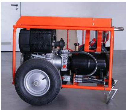
Centralina separata Power pack Groupe hydraulique Hydraulikmotor Paquete de energía