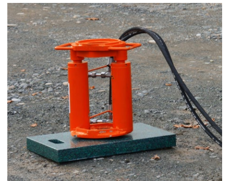
Estrattore idraulico per aste Hydraulisches Ziehgerät Extracteur de tige hydraulique Hydraulischen Stababzieher Extractor hidráulico de barras